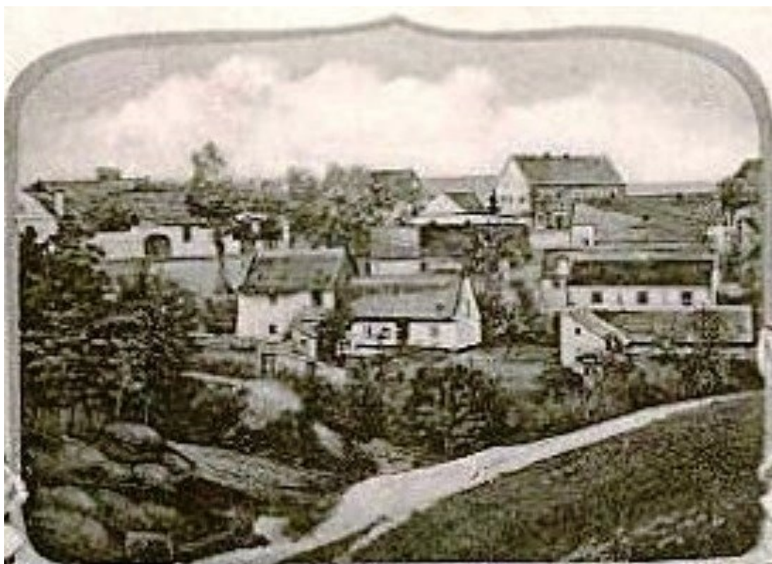
Stará chalupa – uprostřed vlevo, ta se šikmými stěnami (Z pohlednice)

Suchdol se za posledních 100 let hodně změnil. Suchdol prošel také během 20. století bouřlivým vývojem, stejně jako bylo bouřlivé celé 20. století. Z původně zemědělské vesnice, přes dělnickou periferii průmyslové Prahy, prošel transformací až k modernímu velkoměstskému satelitu s vysokoškolským kampusem.